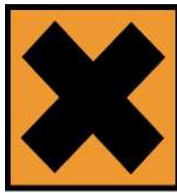
Xn - Nocif

Se reporter à la fiche de données de sécurité.