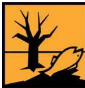
N - Dangereux pour l'environnement

Conserver hors de la portée des enfants. Nocif en cas d'ingestion. Au contact d'un acide, dégage un gaz toxique. Irritant pour les yeux et les voies respiratoires. Très toxique pour les organismes aquatiques, peut entraîner des effets néfastes à long terme pour l'environnement aquatique. Conserver le récipient bien fermé et à l'abri de l'humidité. Eviter le contact avec les yeux. En cas de contact avec les yeux, laver immédiatement et abondamment avec de l'eau et consulter un spécialiste. En cas d'ingestion, consulter immédiatement un médecin et lui montrer l'emballage ou l'étiquette ou contacter le centre anti poison le plus proche. Conserver à une température ne dépassant pas 50°C. Eliminer le produit et son récipient comme un déchet dangereux. Eviter le rejet dans l'environnement. Attention ! Ne pas utiliser en combinaison avec d'autres produits, peut libérer des gaz dangereux (chlore)