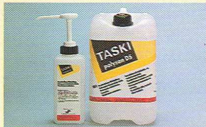
TASKI polysan DS désinfecte, nettoie et entretient. La pompe de dosage facilite la préparation de la solution désinfectante.