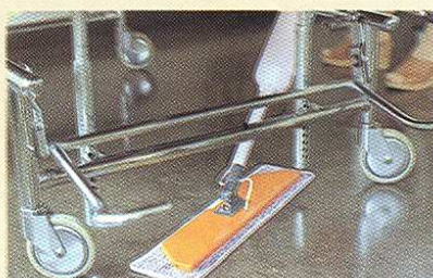
Grâce à sa forme trapézoïdale, l'applicateur DS permet de nettoyer facilement aux angles et endroits difficiles d'accès. Sa genouillère facilite le nettoyage sous les lits.