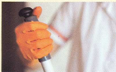
Le débit de la solution désinfectante se règle pendant le travail au moyen du champignon de dosage.