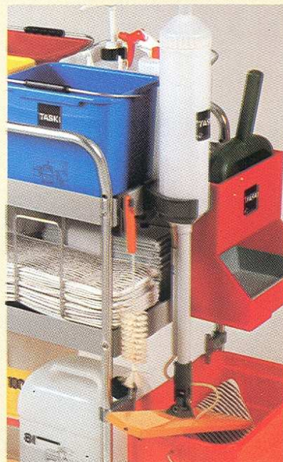
Un support permet de fixer l'applicateur DS sur les chariots de nettoyage.