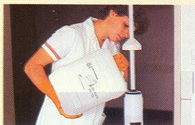
Le remplissage de la solution désinfectante dans l'applicateur est aisé. (1,5 l de solution; suffit pour 75 à 100 m 2 )