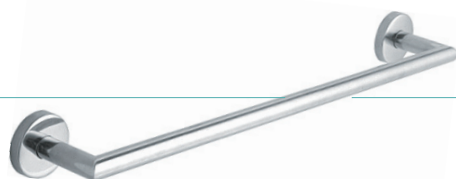
REF 8 99 1440 Porte-serviettes simple UL 1 : 24