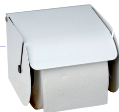
REF 8 99 619 PH Rouleau Metal blanc UL 1 : 20