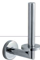
REF 8 99 1444 Porte rouleau réserve PH UL 1 : 28