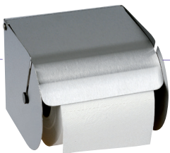
REF 8 99 620 PH Rouleau Metal UL 1 : 20