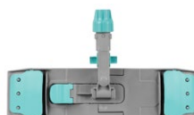
Support Wet System Light avec Block System