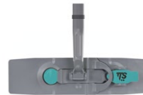
Support Blik Infinity