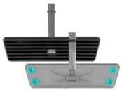
Balai trapèze à lamelles Infinity