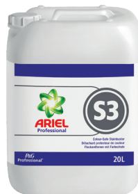
ARIEL PROFESSIONAL S3 DÉTACHANT PROTECTEUR DE COULEUR