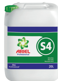
ARIEL PROFESSIONAL S4 BLANC MAX