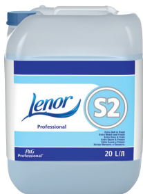
LENOR PROFESSIONAL S2 ADOUCISSANT