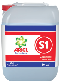
ARIEL PROFESSIONAL S1 DÉTERGENT ACTILIFT