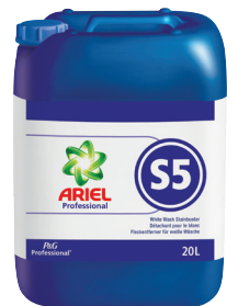
ARIEL PROFESSIONAL S5 DÉTACHANT POUR LE BLANC